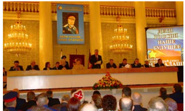
Президиум первого Общероссийского съезда общественной организации «Военно-спортивный Союз М.Т. Калашникова»