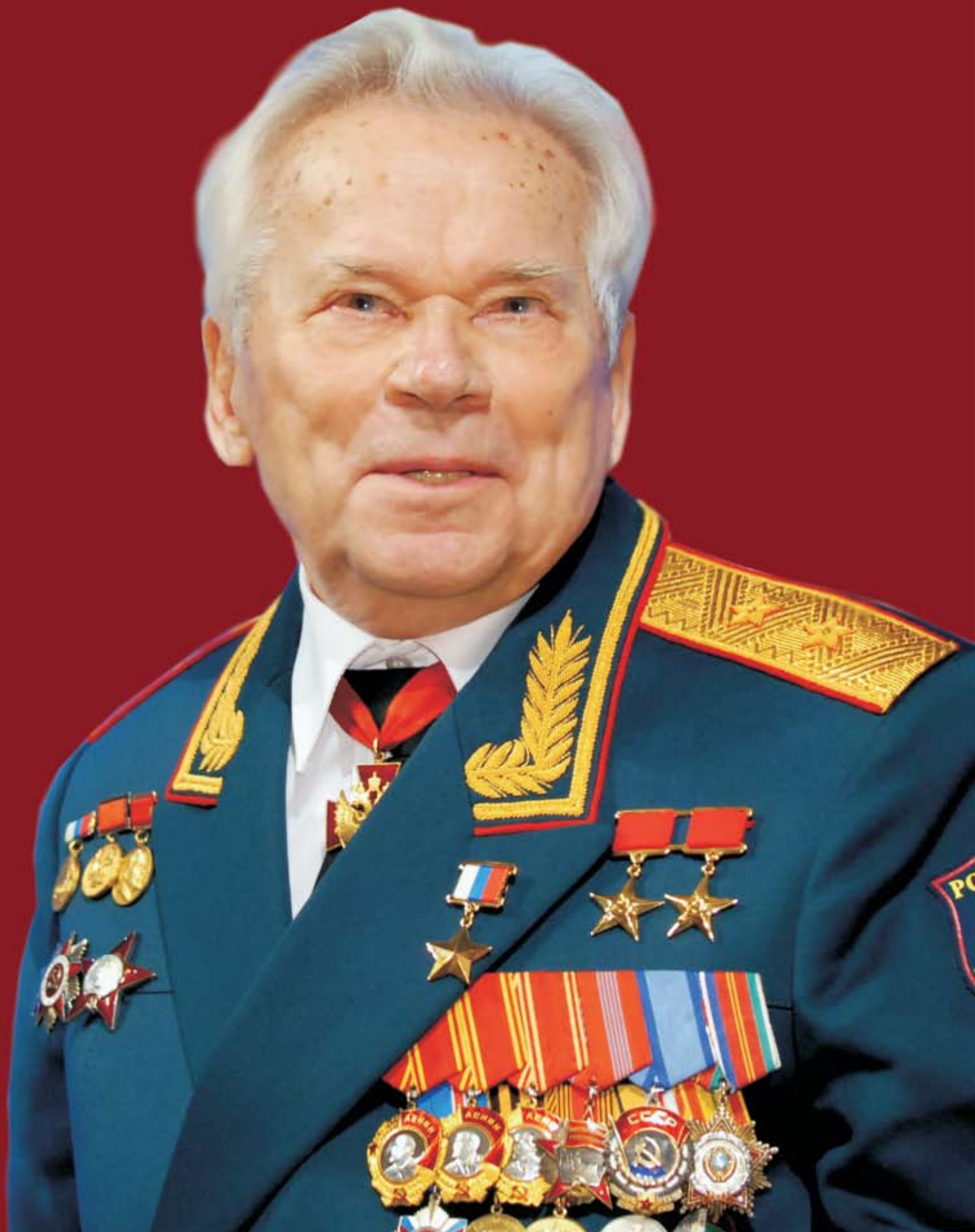
Президент Общероссийской общественной организации «Военно-спортивный Союз М.Т. Калашникова» Калашников Михаил Тимофеевич