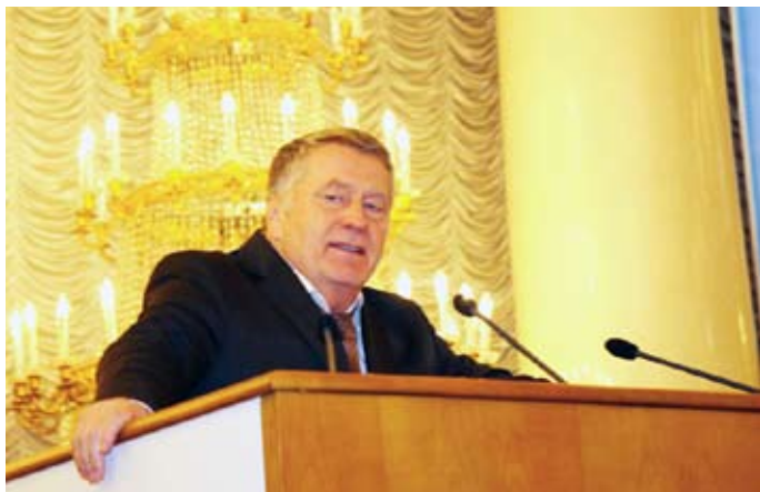
Приветственное слово от партии ЛДПР сказал Председатель партии Жириновский В.В.